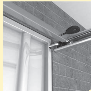
afb. 1: stalen kanteldeur