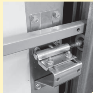
afb. 3: toepassing bij een sectionaal deur