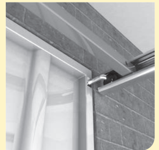
afb. 2: stalen kanteldeur