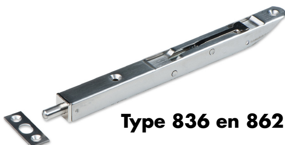
Type 836 en 862

RVS AISI 304 Ideaal voor de toepassing in kustgebieden, de scheepvaart, zwembaden etc.