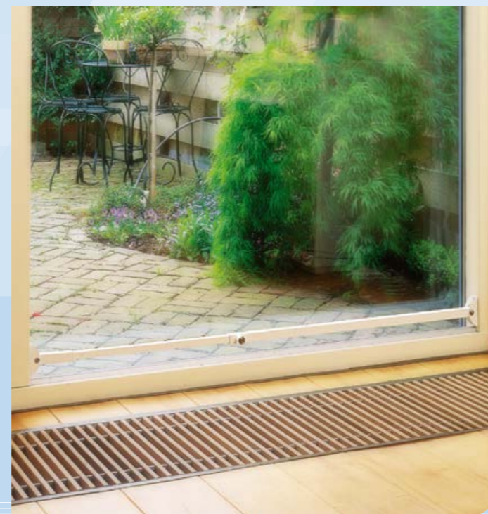
geschikt voor alle soorten schuifpuien

*de overspanning is het deel waarin de beveiliging gemonteerd wordt, **montagemateriaal voor hout meegeleverd