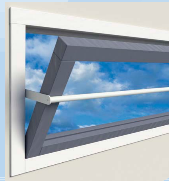
model in de dag