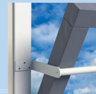
model op de dag