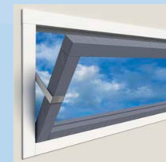
standaard valijzers kunnen makkelijk omgebogen worden