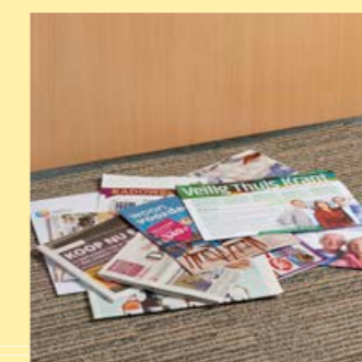
geen post meer op de grond