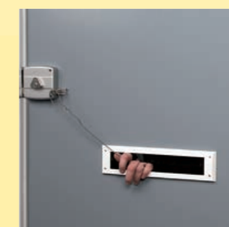
beschermt tegen 'hengelen'