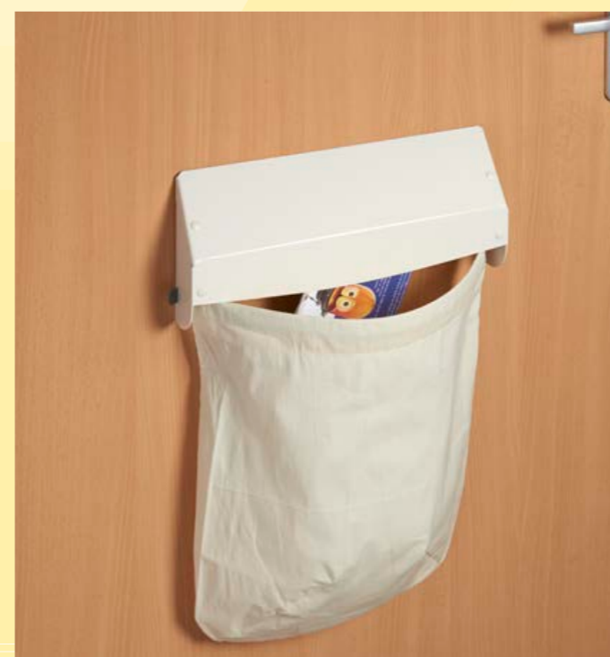
post is makkelijk te grijpen en is bovendien buiten bereik van huisdieren (zak is optioneel)