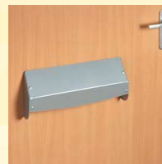
ook verkrijgbaar in zilvergrijs