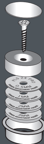
Voorbeelden werking magnetisme verhogende opvulplaatjes.